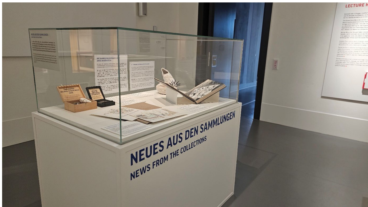
Freifläche im Raum Hörsaal