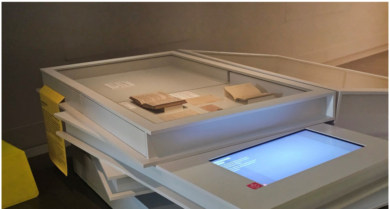
Freifläche im Raum Schreibtisch

Podestmaße: 80 x 80 cm bzw. 110 x 110 cm, eins mit Möglichkeit zur Filmwiedergabe.